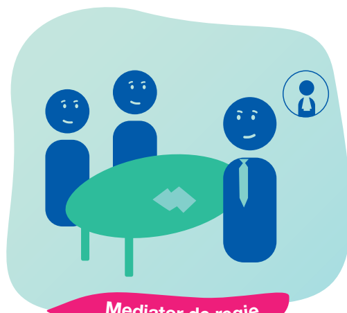
Mediator de regie