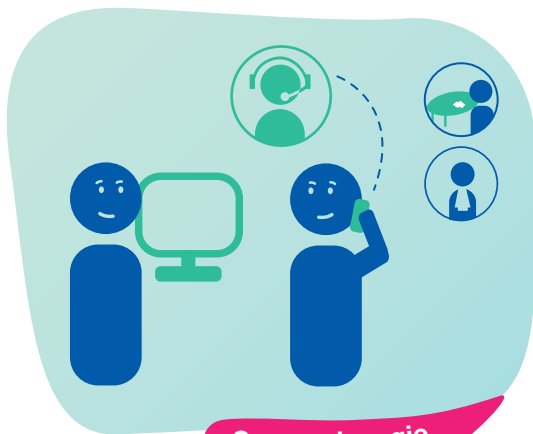
Samen de regie