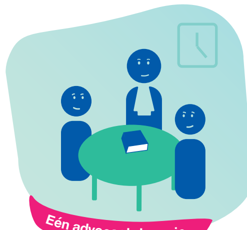
Eén advocaat de regie