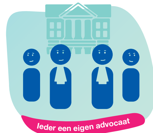
Ieder een eigen advocaat