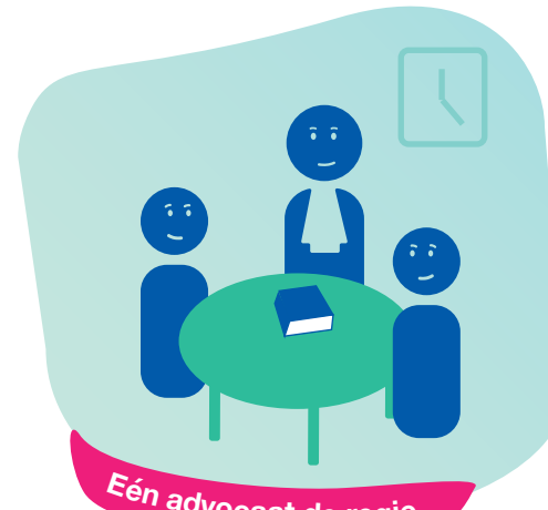
Eén advocaat de regie